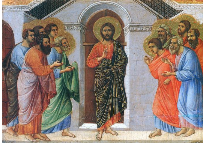
Duccio di Boninsegna, Gesù appare a porte chiuse (1311), Siena

Gli Esercizi spirituali nel quotidiano sono ormai una tappa consolidata del nostro cammino diocesano. Anche quest'anno vogliamo vivere insieme un tempo comune di meditazione e preghiera e affidare al Signore il nuovo anno liturgico, secondo anno del cammino sinodale delle Chiese in Italia.